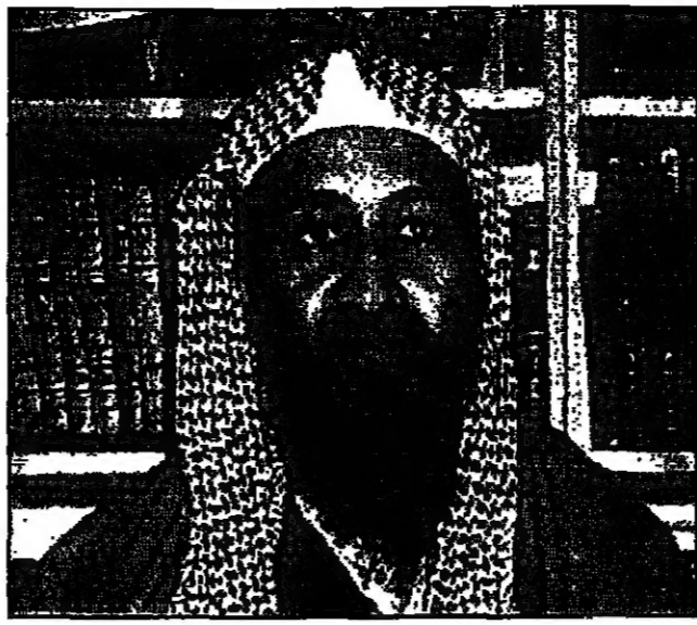
اسلمة بن لادن

لندن - «القدس العربي»: حذر رجل الأعمال السعودي المعارض اسامة بن لادن الولايات المتحدة من هجمات جديدة ضد قواتها في السعودية. وقال في حديث لصحيفة «الانديبندينت» البريطانية اجراء مراسلها في الشرق الاوسط روبرت فيسك في مقابلة معه في جبال شرق افغانستان انه تمكن من الحصول على تاييد آلاف الباكستانيين لهجده ضد القوات الامريكية في الخليج. وأشار بن لادن الى ان مسؤولين سعوديين يؤيدون مسؤوسه طرد الامريكيين من الخليج. ويكشف انه على عرشه رسميا من السلطات السعودية عهدها لتجديده له وجواز سفره ولبطاقة ريزال سعودي لاسرته مقابل تخليه عن دعواته للجهاد ضد الامريكيين وعونه في المملكة. وفي بن لادن، وهو رجل اعمال ثري تهجمه مطرقة في بن لادن ما كان قد تخرير ارضي يسمى اربابا، فان هذا شرف كبير.